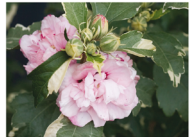
Hibiscus syriacus 'America Irene Scott' PP#20579 CBR#3582

Para ver preguntas e instrucciones de cuidado completas, visita ProvenWinners.com/ShrubCare