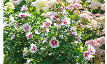
Hibiscus 'Minsywhi07' PPAF CBRAF

Para ver preguntas e instrucciones de cuidado completas, visita ProvenWinners.com/ShrubCare