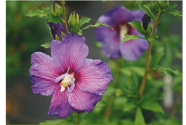
Hibiscus 'Minsybv3s01' PPAF CBRAF

Para ver preguntas e instrucciones de cuidado completas, visita ProvenWinners.com/ShrubCare