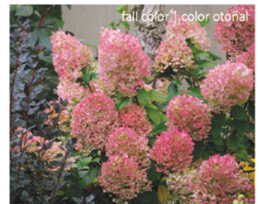
Hydrangea paniculata 'ILVOBO' PP#22782 CBR#4910

Para ver preguntas e instrucciones de cuidado completas, visita ProvenWinners.com/ShrubCare