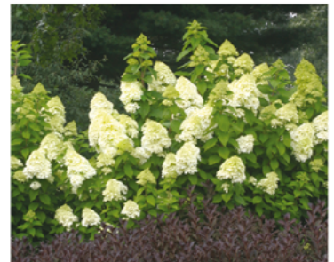
Hydrangea paniculata 'Limelight' PP#12874 CBR#2319

Para ver preguntas e instrucciones de cuidado completas, visita ProvenWinners.com/ShrubCare