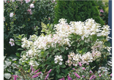
Hydrangea paniculata 'SMHPLQF' PP#25136 CBR#5406

Para ver preguntas e instrucciones de cuidado completas, visita ProvenWinners.com/ShrubCare