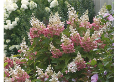
Hydrangea paniculata 'DVP PINKY' PP#16166 CBR#2889

Para ver preguntas e instrucciones de cuidado completas, visita ProvenWinners.com/ShrubCare