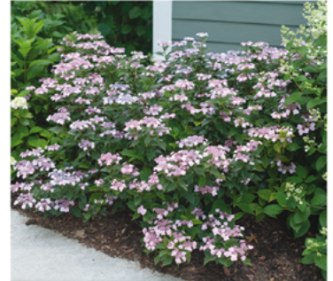
Hydrangea serrata 'MAKD' PP#24842 CBR#5125

Para ver preguntas e instrucciones de cuidado completas, visita ProvenWinners.com/ShrubCare