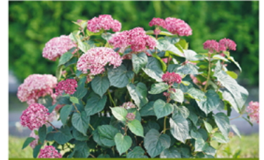
Hydrangea arborescens 'NCHA6' PPAF CBRAF

Para ver preguntas e instrucciones de cuidado completas, visita ProvenWinners.com/ShrubCare