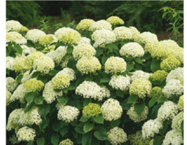
Hydrangea arborescens 'NCHA8' PPAF CBRAF

Para ver preguntas e instrucciones de cuidado completas, visita ProvenWinners.com/ShrubCare