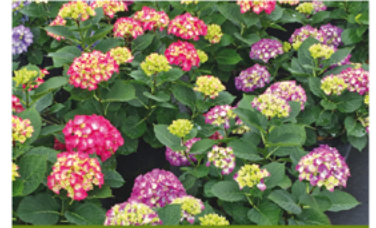
Hydrangea macrophylla 'SMNHML' PPAF CBRAF

Para ver preguntas e instrucciones de cuidado completas, visita ProvenWinners.com/ShrubCare