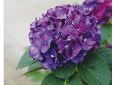
Hydrangea macrophylla 'Stragrum'

Para ver preguntas e instrucciones de cuidado completas, visita ProvenWinners.com/ShrubCare