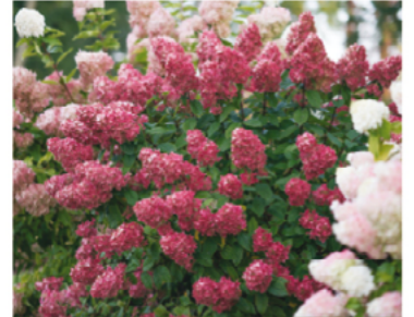
Hydrangea paniculata 'SMHPFL' PP#25135 CDR#5160

Para ver preguntas e instrucciones de cuidado completas, visita ProvenWinners.com/ShrubCare