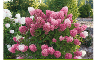
Hydrangea paniculata 'SMNHPRZEP' PP#26956 CBRAF

Para ver preguntas e instrucciones de cuidado completas, visita ProvenWinners.com/ShrubCare