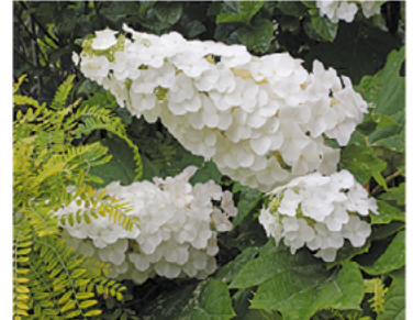
Hydrangea quercifolia 'JoAnn' PP#27879 CDR#5639

Para ver preguntas e instrucciones de cuidado completas, visita ProvenWinners.com/ShrubCare