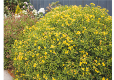
Hypericum 'Deppe' PP#20045 CBR#3587

Para ver preguntas e instrucciones de cuidado completas, visita ProvenWinners.com/ShrubCare