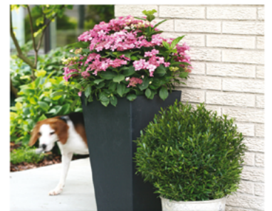
Ilex glabra 'SMNIGAB17' PP#27554 CBR#5629

Para ver preguntas e instrucciones de cuidado completas, visita ProvenWinners.com/ShrubCare