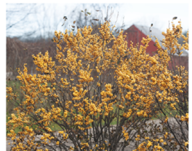
Ilex verticillata 'Roberta Case'

Para ver preguntas e instrucciones de cuidado completas, visita ProvenWinners.com/ShrubCare