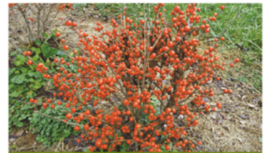
Ilex verticillata 'NCIV2' PP#28938 CBRAF

Para ver preguntas e instrucciones de cuidado completas, visita ProvenWinners.com/ShrubCare