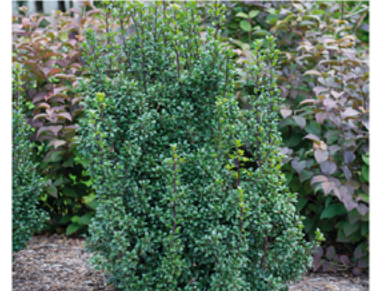
Ilex x meserveae 'Heckenstar' PP#14308

Para ver preguntas e instrucciones de cuidado completas, visita ProvenWinners.com/ShrubCare