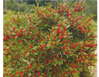
Ilex verticillata 'NCIV1' PP#27109 CBRAF

Para ver preguntas e instrucciones de cuidado completas, visita ProvenWinners.com/ShrubCare