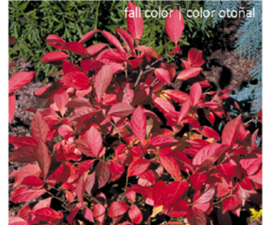
Itea virginica 'Sprich' PP#10988

Para ver preguntas e instrucciones de cuidado completas, visita ProvenWinners.com/ShrubCare