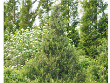
Juniperus chinensis 'RIKAG' PPAF CBRAF

Para ver preguntas e instrucciones de cuidado completas, visita ProvenWinners.com/ShrubCare