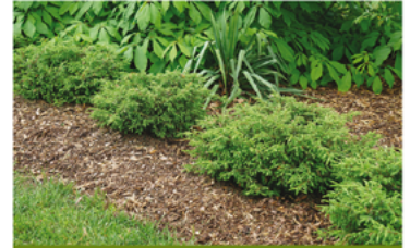
Juniperus communis 'SMNJCB' PPAF CBRAF

Para ver preguntas e instrucciones de cuidado completas, visita ProvenWinners.com/ShrubCare