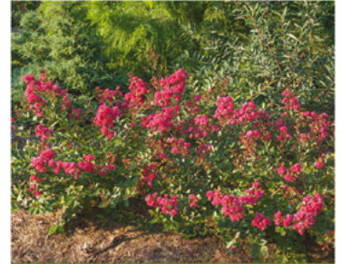
Lagerstroemia indica 'G2X133271' PP#27474

Para ver preguntas e instrucciones de cuidado completas, visita ProvenWinners.com/ShrubCare