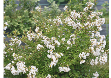
Lagerstroemia indica 'G2X13377' PPAF

Para ver preguntas e instrucciones de cuidado completas, visita ProvenWinners.com/ShrubCare