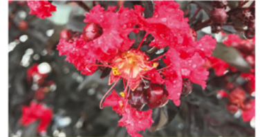
Lagerstroemia indica 'SMNLICBF' PPAF

Para ver preguntas e instrucciones de cuidado completas, visita ProvenWinners.com/ShrubCare