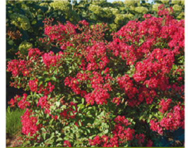
Lagerstroemia indica 'G2X133181' PP#29007

Para ver preguntas e instrucciones de cuidado completas, visita ProvenWinners.com/ShrubCare