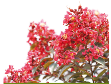
Lagerstroemia indica 'SMNLIMG' PPAF

Para ver preguntas e instrucciones de cuidado completas, visita ProvenWinners.com/ShrubCare