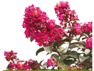
Lagerstroemia indica 'SMNLIDS' PPAF

Para ver preguntas e instrucciones de cuidado completas, visita ProvenWinners.com/ShrubCare