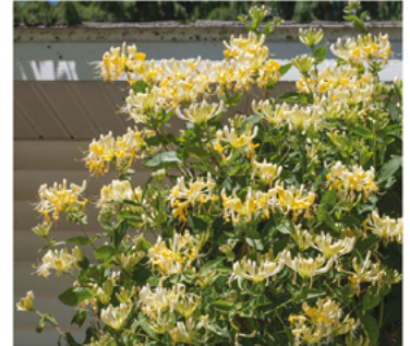
Lonicera periclymenum 'Scentsation' PP#16240 CBRAF

Para ver preguntas e instrucciones de cuidado completas, visita ProvenWinners.com/ShrubCare