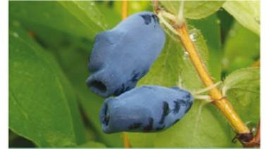
Lonicera caerulea 'Stimul'

Para ver preguntas e instrucciones de cuidado completas, visita ProvenWinners.com/ShrubCare