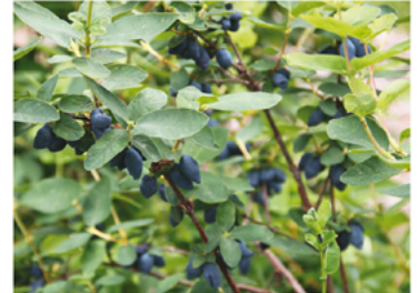
Lonicera caerulea 'Kaido' PP#28662 CBRAF

Para ver preguntas e instrucciones de cuidado completas, visita ProvenWinners.com/ShrubCare