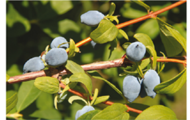
Lonicera caerulea 'Kapu' PP#26320 CBRAF

Para ver preguntas e instrucciones de cuidado completas, visita ProvenWinners.com/ShrubCare