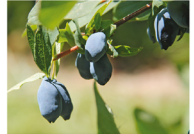
Lonicera caerulea 'Hoka' PP#28593 CBRAF

Para ver preguntas e instrucciones de cuidado completas, visita ProvenWinners.com/ShrubCare