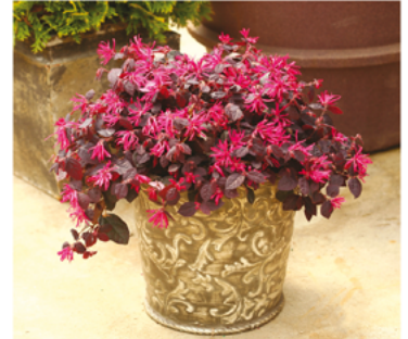
Loropetalum chinense 'Kurenai' PP#27750

Para ver preguntas e instrucciones de cuidado completas, visita ProvenWinners.com/ShrubCare