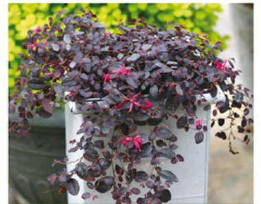
Loropetalum chinense 'Beni Hime' PP#27752

Para ver preguntas e instrucciones de cuidado completas, visita ProvenWinners.com/ShrubCare