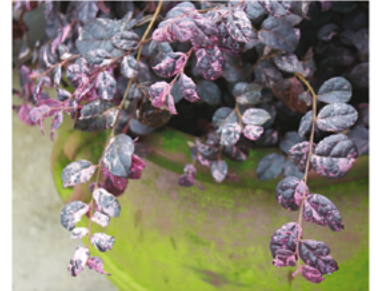
Loropetalum chinense 'Irodori' PPH27713

Para ver preguntas e instrucciones de cuidado completas, visita ProvenWinners.com/ShrubCare