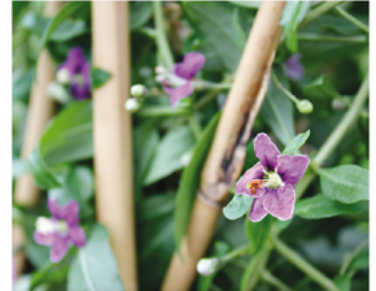
Lycium barbarum 'SMNDBL'

Para ver preguntas e instrucciones de cuidado completas, visita ProvenWinners.com/ShrubCare