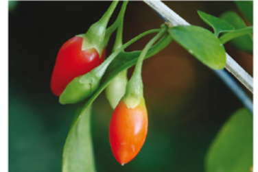
Lycium barbarum 'SMNLBBB' PPAF CBRAF

Para ver preguntas e instrucciones de cuidado completas, visita ProvenWinners.com/ShrubCare