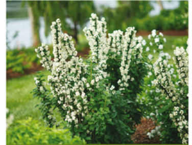
Philadelphus coronarius 'SMNPVG' PPAF CBRAF

Para ver preguntas e instrucciones de cuidado completas, visita ProvenWinners.com/ShrubCare