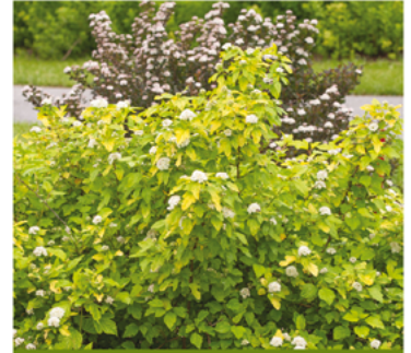
Physocarpus opulifolius 'Bert Dart's G' PP#26246 CBRAF

Para ver preguntas e instrucciones de cuidado completas, visita ProvenWinners.com/ShrubCare