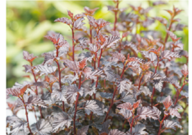
Physocarpus opulifolius 'SMNPMS' PPAF CBRAF

Para ver preguntas e instrucciones de cuidado completas, visita ProvenWinners.com/ShrubCare