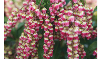
Pieris japonica 'FARROWPJRF' PPAF CBRAF

Para ver preguntas e instrucciones de cuidado completas, visita ProvenWinners.com/ShrubCare