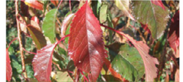
Prunus x 'Extrazam'

Para ver preguntas e instrucciones de cuidado completas, visita ProvenWinners.com/TreeCare