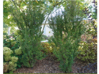
Prunus incisa 'Rinpo'

Para ver preguntas e instrucciones de cuidado completas, visita ProvenWinners.com/ShrubCare