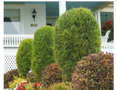
Rhamnus frangula 'Ron Williams' PP#14791

Para ver preguntas e instrucciones de cuidado completas, visita ProvenWinners.com/ShrubCare