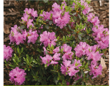
Rhododendron 'Amy Cotta' PP#11311

Para ver preguntas e instrucciones de cuidado completas, visita ProvenWinners.com/ShrubCare