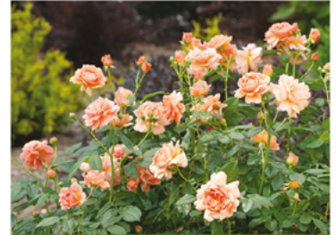
Rosa 'HORCOGJIL' PP#27541 CBR#5631

Para ver preguntas e instrucciones de cuidado completas, visita ProvenWinners.com/ShrubCare