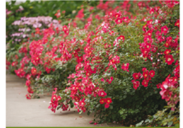
Rosa 'Meiboulka' PP#19258 CBR#4870

Para ver preguntas e instrucciones de cuidado completas, visita ProvenWinners.com/ShrubCare